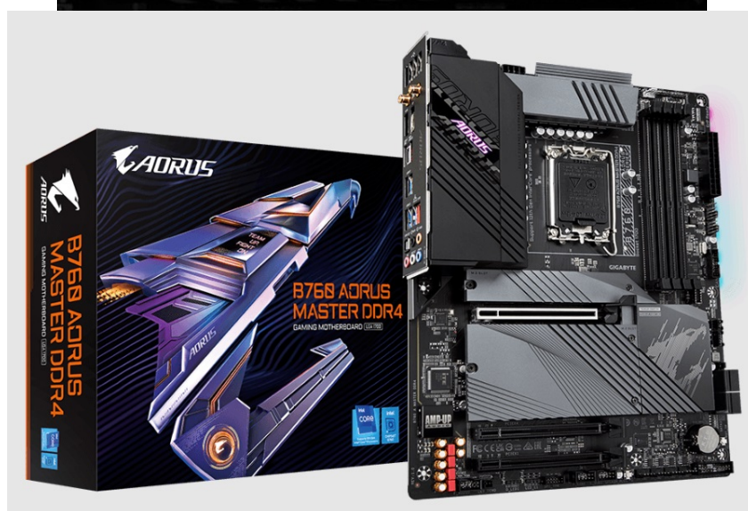
GIGABYTE B760 AORUS MASTER DDR4