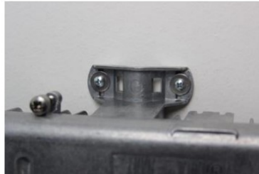
na stěnu (montážní materiál není součástí balení)