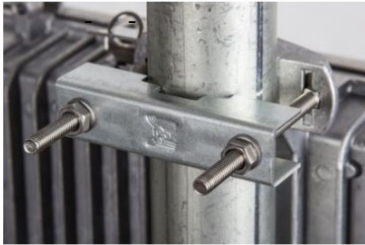
ø 21 - 54 mm třmen (součást balení T)