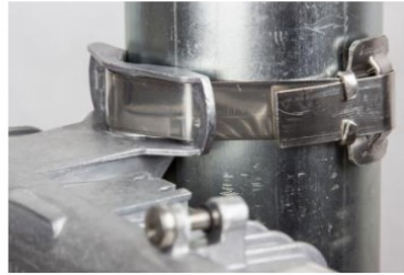
ø ≥ 19 mm nekonečný kovový pásek, spona apod. (max. šířky 19 mm, není součástí balení)